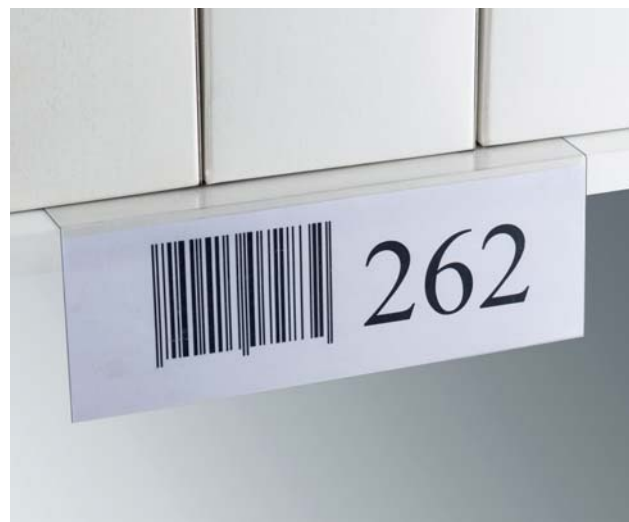
Schlichte Schildleiste für Regalböden (SLR70-200) zum Anbringen von Strichcodes oder Produktinfos