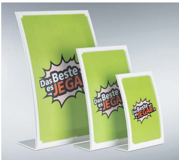
Formschöner L-Ständer (WL-50/-51/-52) in A4/A5/A6 mit transparenter Abdeckung.